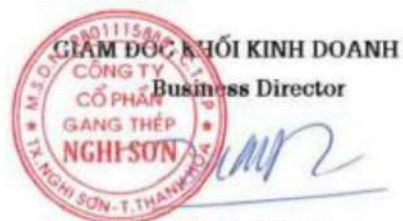
Cao Tuấn Thành